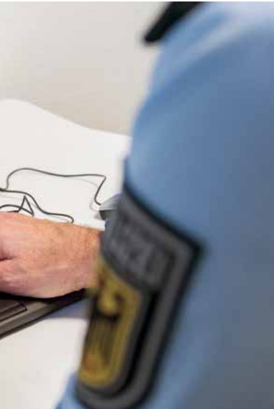
Ob im Büro oder im mobilen Einsatz: Mit der SINA Workstation S verfügt die Bundespolizei über einen hochsicheren und mobilen Arbeitsplatz

Die Bundespolizei hatte bereits auf einem anderen Feld umfangreiche Erfahrungen mit SINA gesammelt: Seit 2002 realisiert sie als einer der ersten SINA Kunden die hochsichere Vernetzung ihrer Standorte mit dieser Technologie. Die positiven Erfahrungswerte haben den Kunden bestärkt, auch die neue Herausforderung – die sichere Anbindung der mobilen und dezentralen Arbeitsplätze – mit SINA umzusetzen.